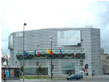
Médiathèque d'Orléans Place Gambetta (1994)