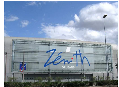
Zénith d'Orléans RN20 (1996)

Inaugurée en 2000, la première ligne de tramway réduit la fracture de la ville en reliant la gare des Aubrais, au nord, à La Source, situé au sud. L'affluence bouleverse les habitudes. Le tramway facilite l'accès au centre-ville et diminue le temps des trajets.