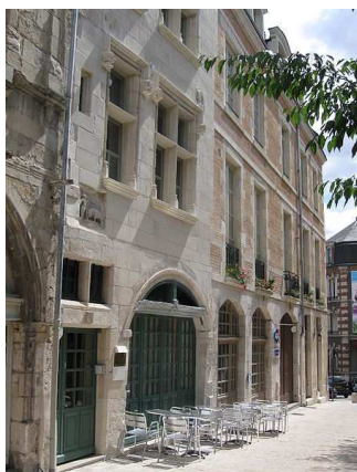
Maison Jean D'Alibert Rue du Châtelet (1560)

Avec le retour des hachurages caractéristiques des façades à pans de bois, le slogan de la ville « Orléans donne un avenir à son passé » prend tout son sens.