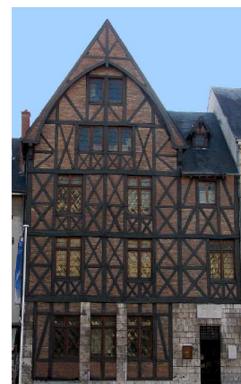
Maison Jeanne d'Arc Place du G al -de-Gaulle (1425)