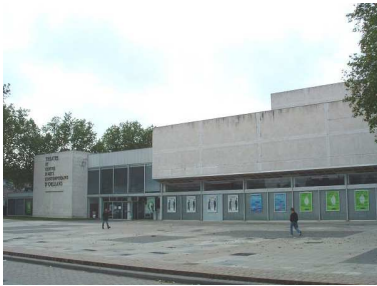
Théâtre d'Orléans Bd Aristide Briand (Rénovée en 2004)