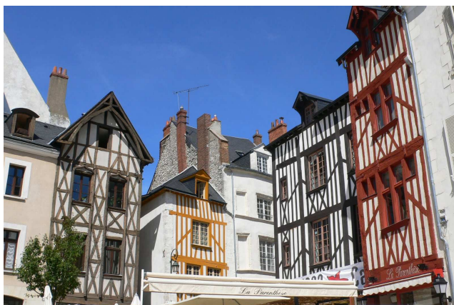
Maisons à pans de bois Place du Châtelet (2e moitié 15e siècle)