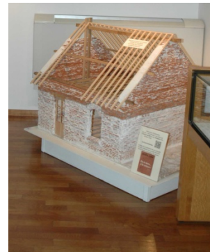
Maison en briques (échelle 1/7 ème )