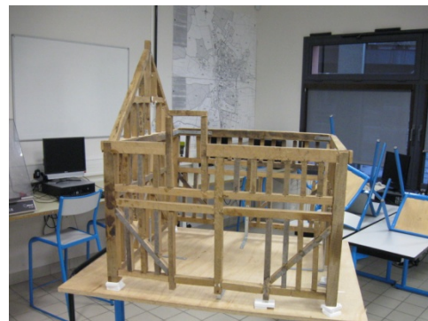
Maison à colombage (échelle 1/7 ème )