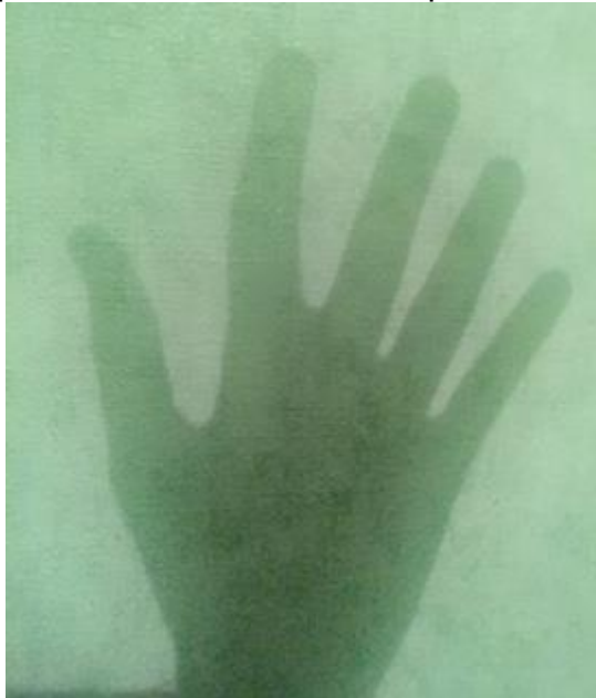
main (pour les GS main droite ou main gauche ?)