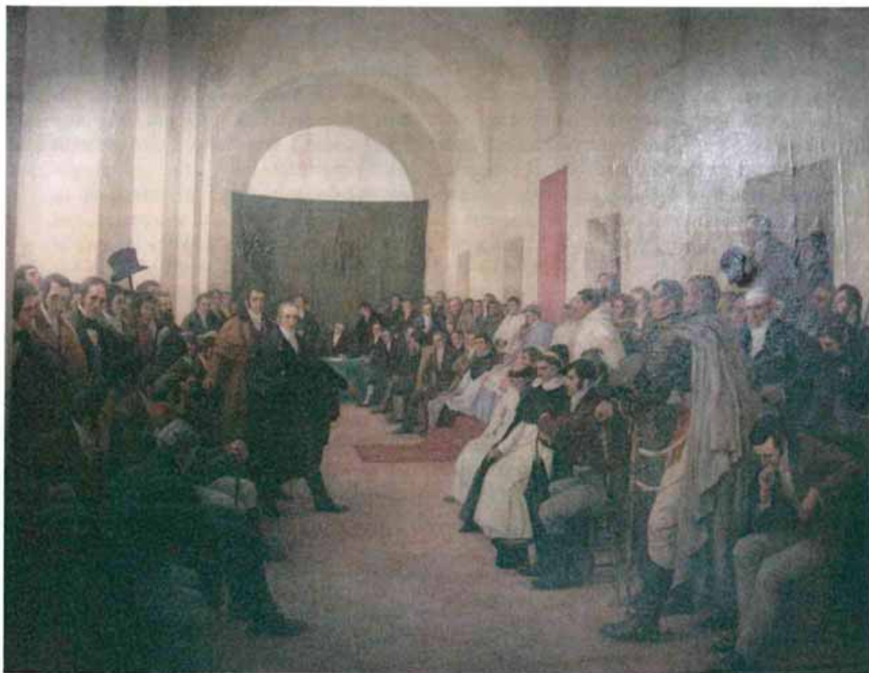
Pedro Subercaseaux Errázuriz, Cabildo abierto del 22 de Mayo de 1810. Proclamación en Buenos Aires de la Independencia del Virreinato del Río de la Plata.