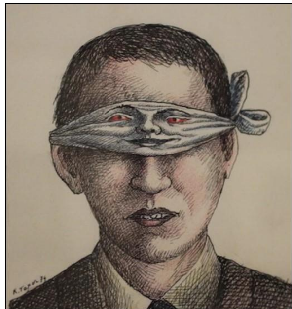
Sans titre, Roland Topor (1975)

Tu veux bien nous raconter ton histoire ?