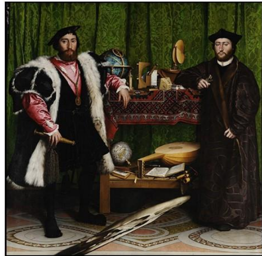
Les Ambassadeurs, Hans Holbein le Jeune (1533)