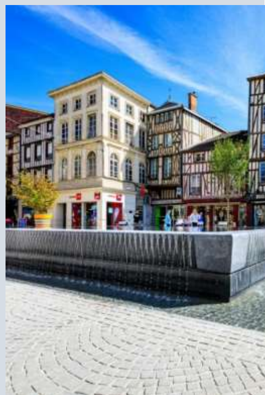
Châlons-en-Champagne, un hyperlieu pour l'enseignement de l'histoire et de la géographie.

Pour plus d'informations, vous pouvez contacter l'IA-IPR en charge du dossier : virginie.carton@ac-orleans-tours.fr