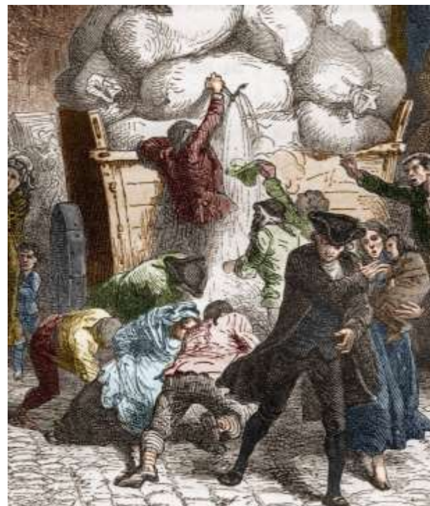
La guerre des farines en 1775.