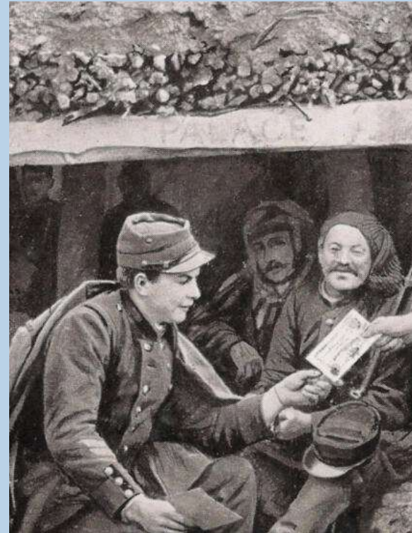
« L'heure du vaguemestre », carte postale (1914)

> Découvrir et raconter la Première Guerre mondiale par l'écriture d'une correspondance (classe de 3 ème )