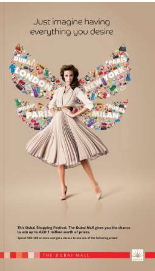
Une publicité pour The Dubaï Mall, un hyperlieu.