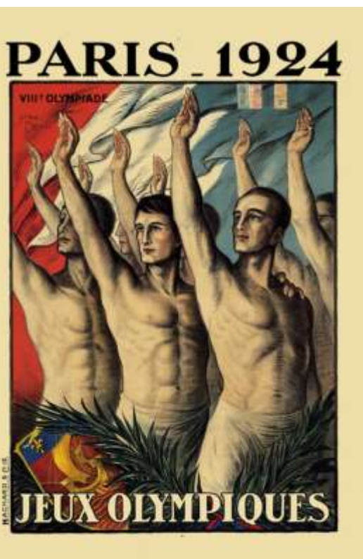
Affiche des Jeux Olympiques de Paris, 1924.

> La lettre d'information Mémoires et Citoyenneté