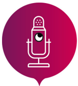
LA FABRIQUE À CHANSONS