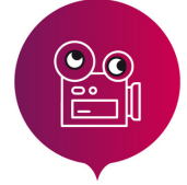
LA FABRIQUE MUSIQUE ET IMAGE