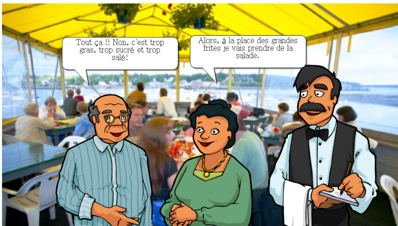
Frame 2 of 3

Alors, à la place des grandes frites je vais prendre de la salade.