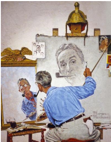
Norman Rockwell – Triple autoportrait