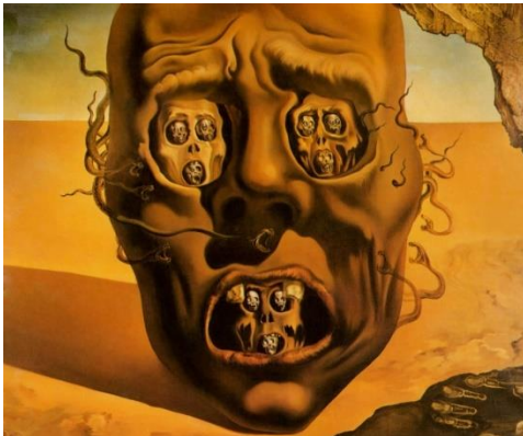
Le visage de la guerre – Peinture de Salvador Dali

Voici quelques mises en abyme en peinture :