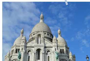
Figure 3 : Le Sacré Cœur