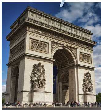
Figure 2 : L'Arc de Triomphe