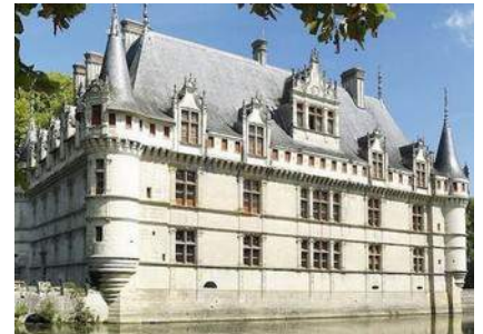
Azay le Rideau