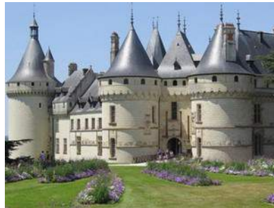
Chaumont sur Loire