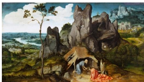
Joachim Patinir (vers 1480-1584), Saint Jérôme dans le désert , vers 1515-1520, huile sur panneau de bois, H : 78 cm, L : 137 cm. Paris, musée du Louvre.