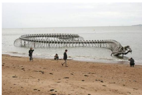
Huang Yong Ping (1954-2019), Serpent d'océan , 2012, aluminium, sculpture monumentale, L. : 128 m, H. : 3 m, création pérenne dans le cadre du parcours Estuaire. Saint-Brevin-les-Pins, Pointe de Mindin, Loire-Atlantique.