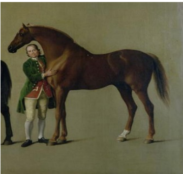
Ici, Whistlejacket est représenté accompagné de son groom en 1762.

une selle / un tapis / un cavalier / une charrette / un palefrenier / une écurie