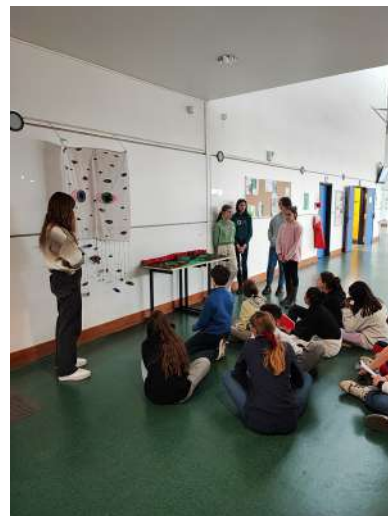
Workshop en salle d'arts plastiques - Collège de Bû (28)