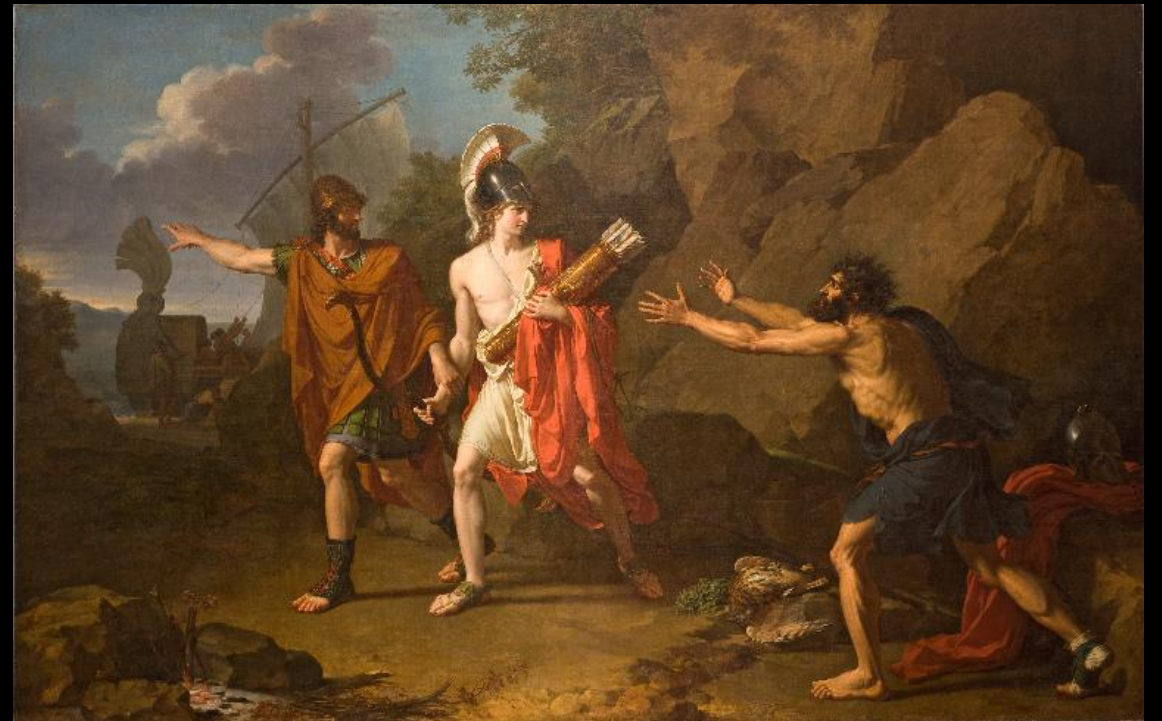
FABRE François-Xavier, Ulysse et Néoptolème enlèvent à Philoctète l'arc et les flèches d'Hercule , 1800, Musée Fabre, Montpellier.

« L'expérience de la nature dans le Philoctète de Sophocle »