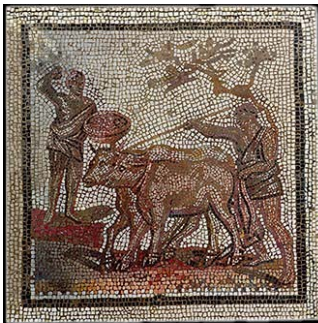
Mosaïque du III e siècle, Musée d'archéologie de Saint-Germain-en-Laye

1) Qui est l'auteur de ce texte et de quel ouvrage est-il extrait ?