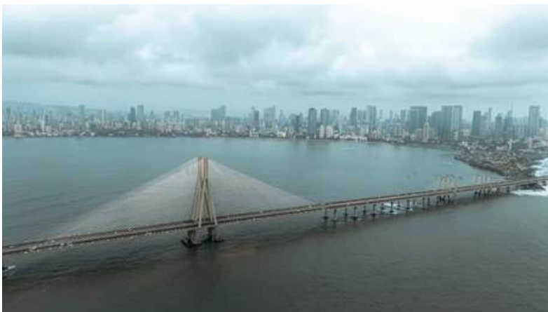
Nouveau pont, ouvert en 2024

https://www.porttechnology.org/jawaharlal-nehru-port-becomes-first-indian-full-landlord-port/