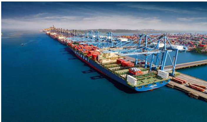
Dernier terminal de l'aéroport de Mumbai, 2014

https://www.porttechnology.org/jawaharlal-nehru-port-becomes-first-indian-full-landlord-port/