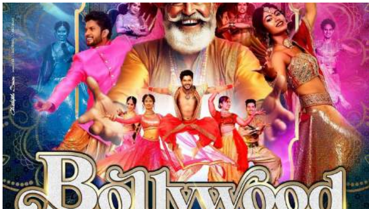
Affiche de la comédie musicale Bollywood 2024

( https://www.franceinfo.fr/culture/spectacles/bollywood-masala-la-capitale-du-cinema-indien-racontee-dans-une-comedie-musicale-dynamique-et-coloree_6977822.html )