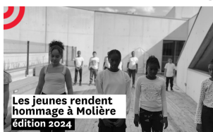
Les jeunes rendent hommage à Molière édition 2024

► Retrouvez les hommages des classes lauréates du jeu-concours « Les jeunes rendent hommage à Molière en 2024 » :