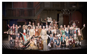
Hommage à Molière 2023