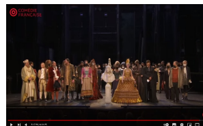
Hommage à Molière 2022