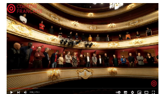
Hommage à Molière 2021

► Retrouvez les hommages des classes lauréates du jeu-concours « Les jeunes rendent hommage à Molière en 2024 » :