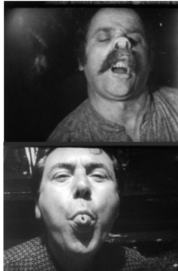
Erró (Gudmundur Gudmundsson, dit) (1932, Islande) Grimace