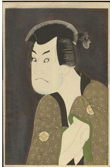
Les grimaces de Sharaku (XVIIIème)