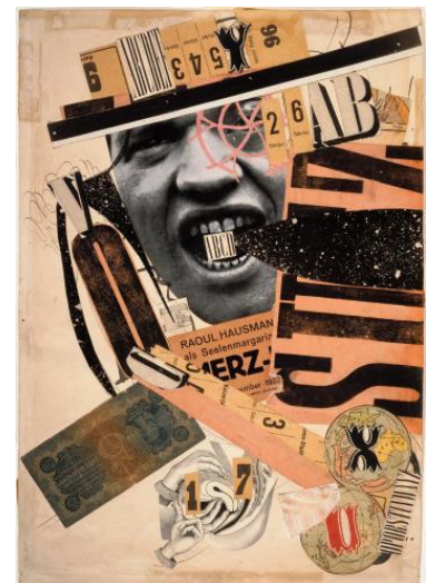
Autoportrait de Raoul Hausmann, ABCD, 1923-24, encre de chine et collage sur papier, 40,4 x 28,2 cm, Centre Georges Pompidou, Paris.