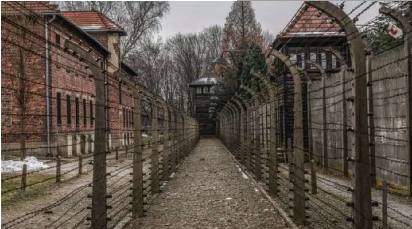
Le camp d'Auschwitz - Birkenau