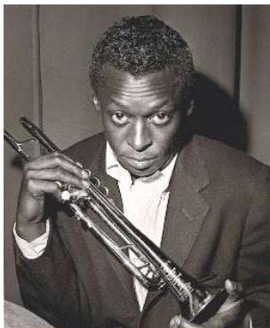
Miles DAVIS, New York, 1948