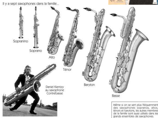
Même si on se sert plus fréquemment des saxophones sopranos, altos, ténors et barytons, les autres membres de la famille sont aussi utilisés dans les grands ensembles de saxophones.