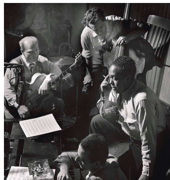
Charlie PARKER (à droite), New York, 1949

Le photographe américain Herman LEONARD (1923-2010) a été le photographe privilégié de nombreux musiciens de jazz et notamment Sonny ROLLINS, Miles DAVIS et Charlie PARKER. Ses célèbres photographies, en noir et blanc, mettent en valeur les visages par l'utilisation de contrastes et font souvent apparaître des nuages de fumée.