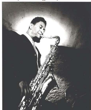
Sonny ROLLINS, Paris, 1960