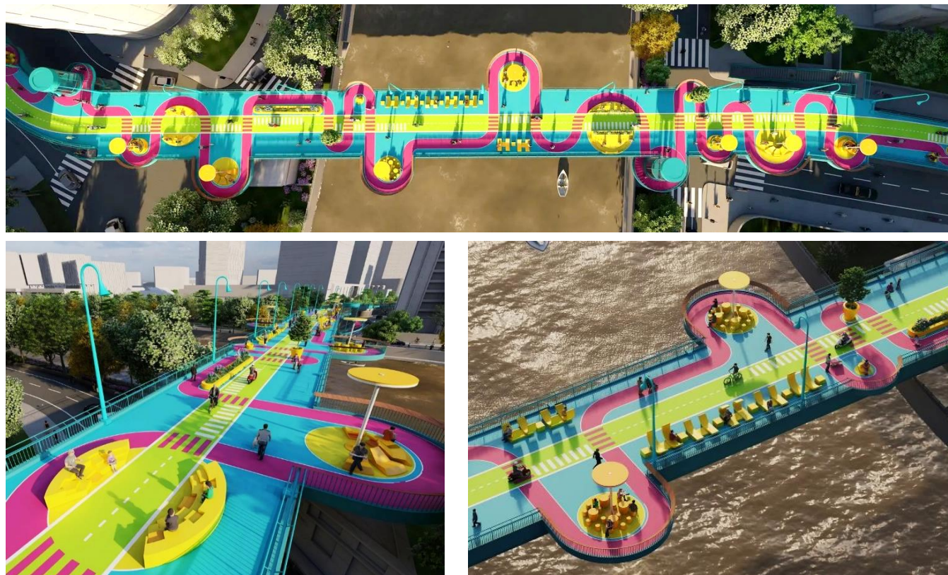
Pont High Loop - Shanghai. https://100architects.fr/

a) Identifier la fonction d'usage principale de ce pont :