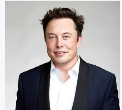
Elon Musk Chef d'entreprise