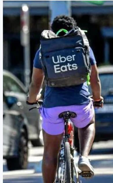
Un livreur Uber Eats