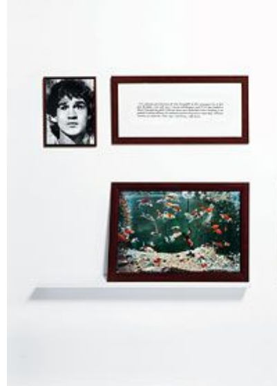
Sophie Calle – Aveugles - 1986