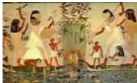
Scène de chasse et de pêche (1500 av J-C)

La perspective symbolique Les personnages les plus importants sont plus grands que les autres