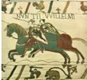
La tapisserie de Bayeux (XIe)

La « disparition » des éléments cachés par le premier plan