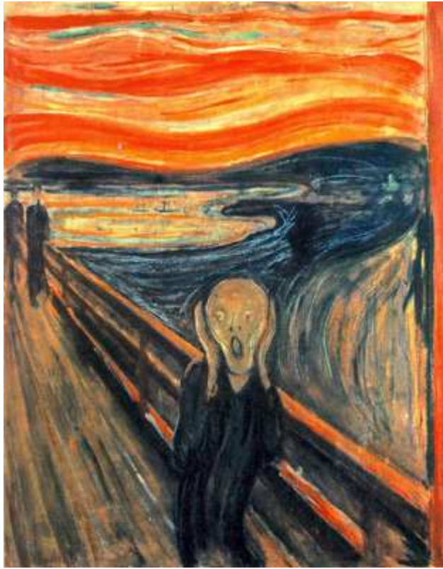
Edward Munch – Le cri