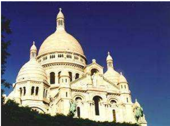
Le sacré coeur