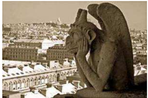
Une chimère de Notre Dame de Paris