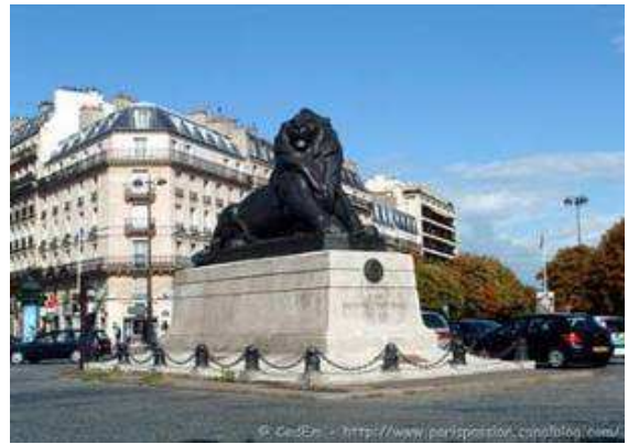
Le lion de Denfert Rochereau