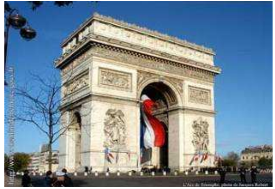
L'arc de Triomphe