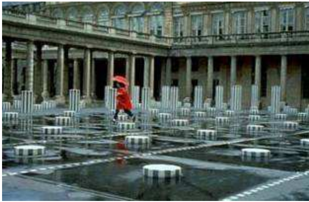
Les colonnes de Buren -