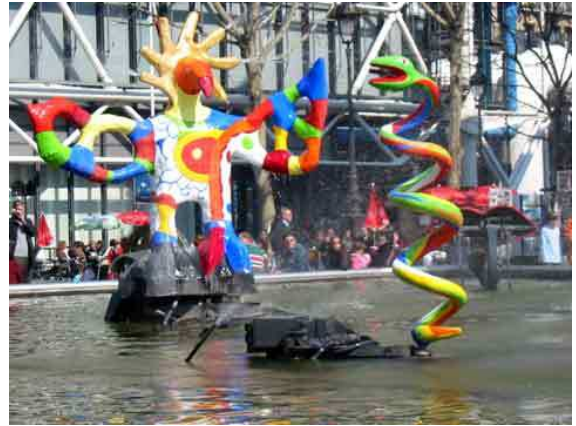
Fontaine du centre pompidou – Tinguely et Niki de Saint-Phalle