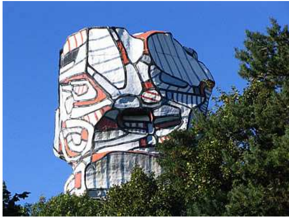
Sculpture de Dubuffet - Ile Saint Germain