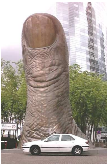
Le pouce de César