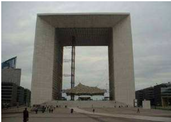
L'arche de la Défense