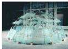
Mario Merz 1965, Papier, 195 x 195 cm Musée de la Ville de Paris, Paris Mario Merz

Imaginer qui peut vivre dans cette maison originale, et comment.