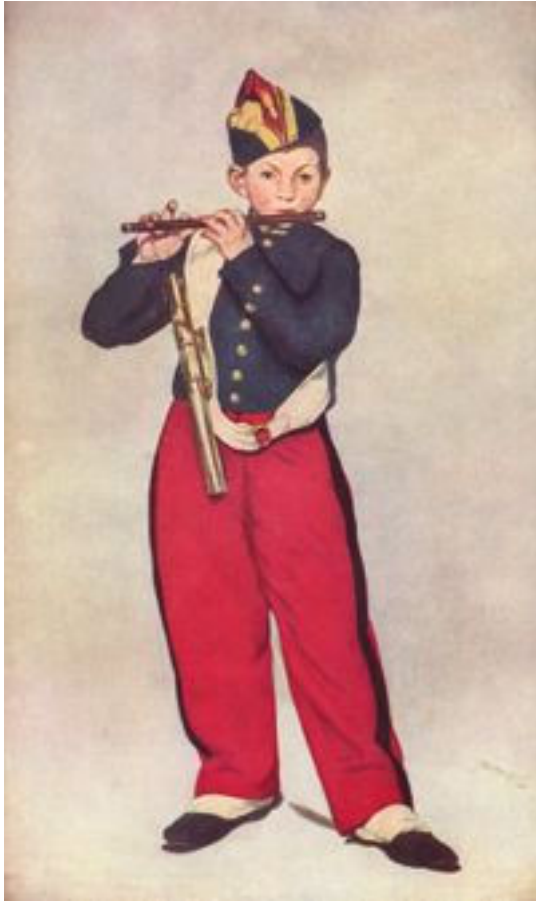
Le joueur de fifre, Edouard Manet