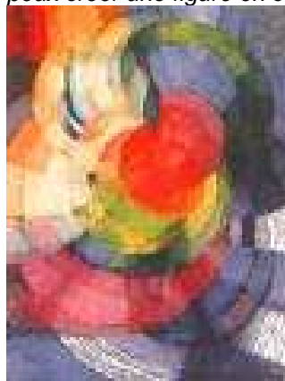
Kupka Disques de Newton. Etude pour la fugue en deux couleurs

Inventer une partition sonore et colorée. Travail sur les analogies musique, arts visuels : espace (horizontalité, verticalité), temps (éléments du dynamisme rythmique), couleur/timbre, forme. « Je tâtonne toujours dans le noir, mais je crois pouvoir trouver quelque chose entre la vue et l'ouïe et je peux créer une figure en couleurs comme Bach l'a fait en musique » Kupka, Nocturne, 1911.